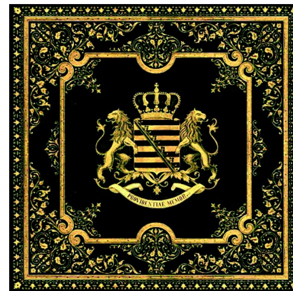
Sächsische Verfassungsurkunde vom 4. September 1831

Durch Referendum*2 soll die Wahlkommission Sachsen für die Bewohner in den Wahlkreisen der einzelnen Gemeinden in den staatlichen Grenzen vom 27.10.1918 die Berechtigung zur Nutzung der ursprünglichen gültigen staatlichen Siegel der Gemeinden und der jeweils zuständigen Kreishauptmannschaften erhalten . Damit kann diese Wahlkommission Amtshilfe für jeden gebürtigen Sachsen leisten und die Verweserwahl*1 für das Königreich Sachsen durchführen .